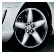
Jantes Alopias 18"