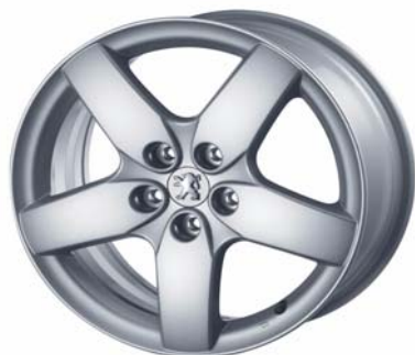
Jantes alliage Quasar 16"

Sur Signature, toutes les jantes alliage sont accompagnées en série de détecteurs de sous-gonflage.