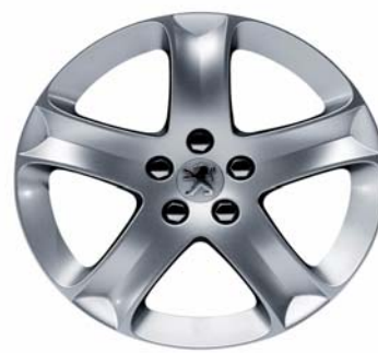
Jantes alliage Cosmos 17"