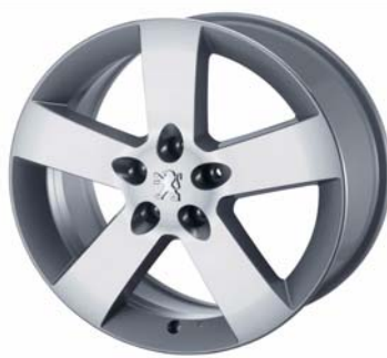
Jantes alliage Hortaz 16"