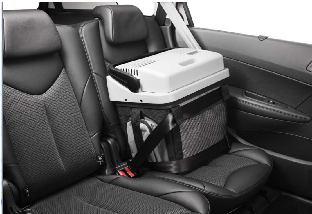
Module isotherme 24L WAECO (REF : 1607002980)

ACCESSOIRES POST USINE EN SERIE SUR VOTRE SERIE SPECIALE FAMILY