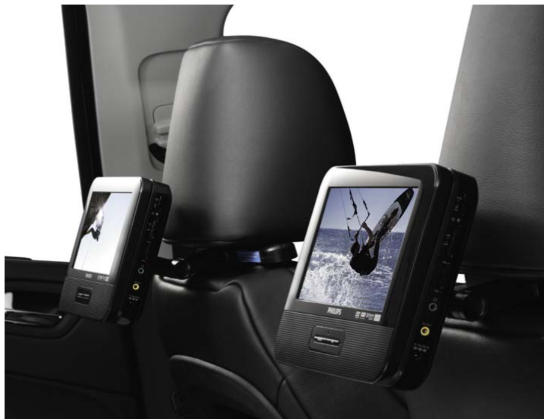
Lecteur DVD double écran PHILIPS (REF : 1606623280)