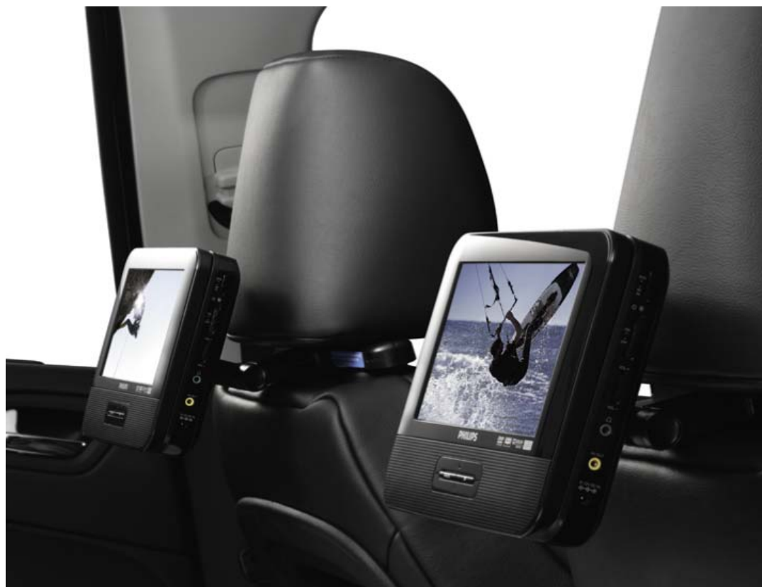
Lecteur DVD double écran PHILIPS (REF : 1606623280)