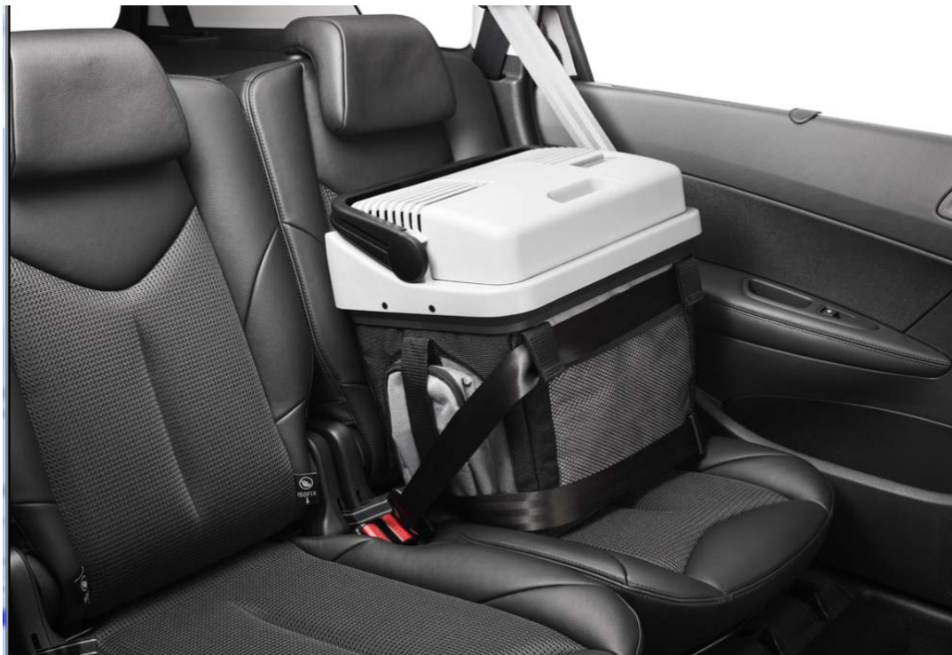
Module isotherme 24L WAECO (REF : 1607002980)

ACCESSOIRES POST USINE EN SERIE SUR VOTRE SERIE SPECIALE FAMILY