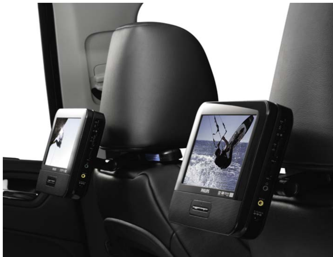
Lecteur DVD double écran PHILIPS (REF : 1606623280)