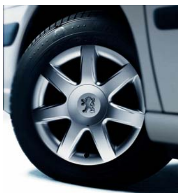
Jantes Alliage 16" Hadès et détecteurs de sous-gonflage