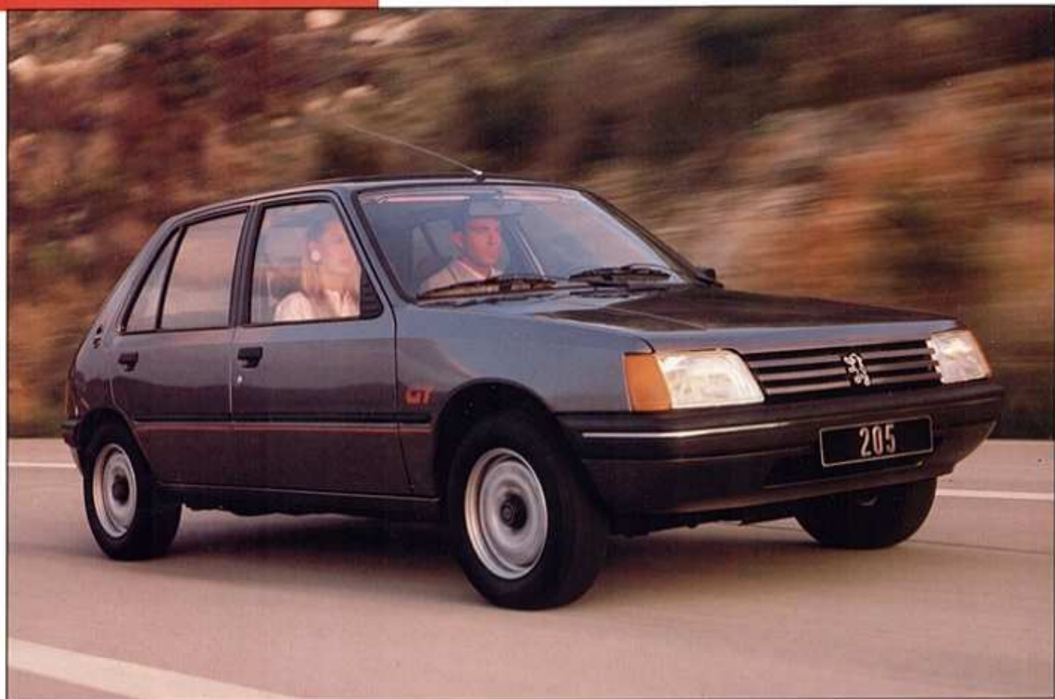
Modèle présenté : 205 GT