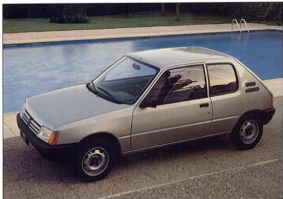
Modèle présenté : 205 XL avec appuis-tête en option