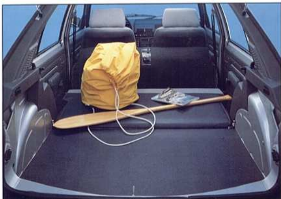
Modèle présenté : 205 GL avec appuis-tête en option