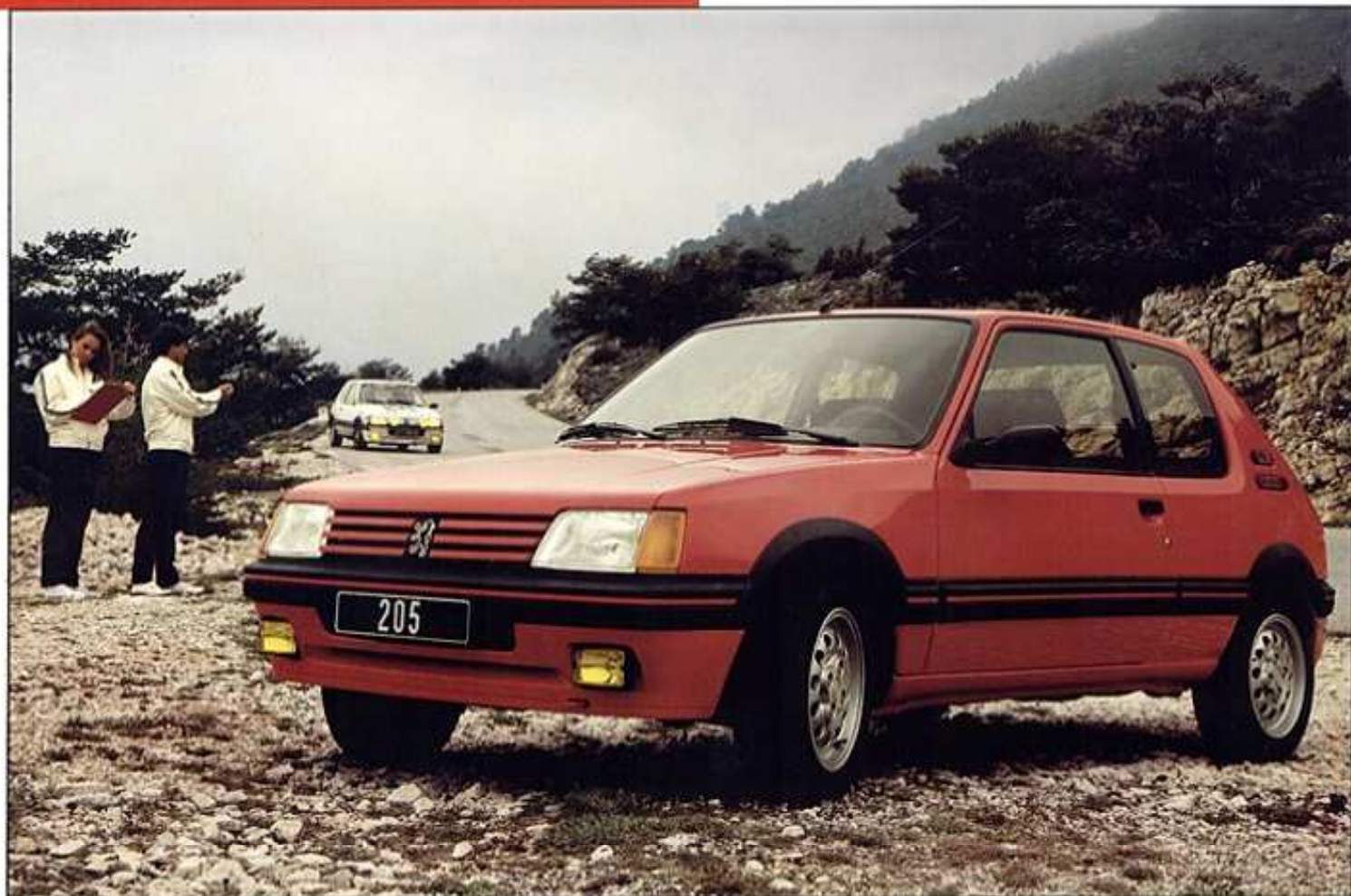
Modello presentato: 205 GTI