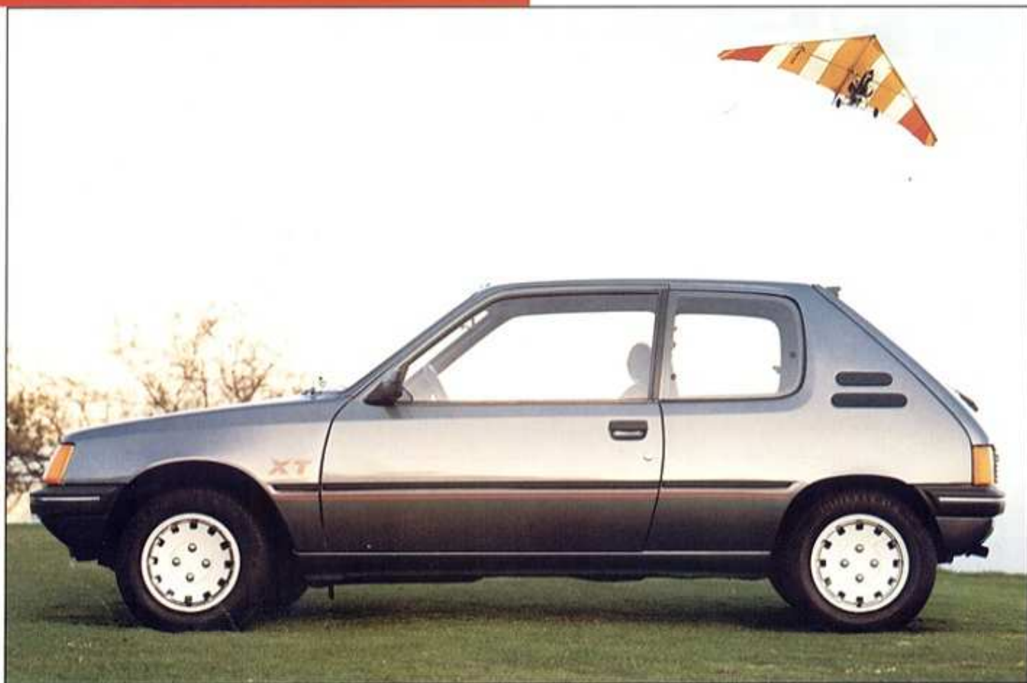
Modèle présenté : 205 XT avec jantes en alliage léger en option.