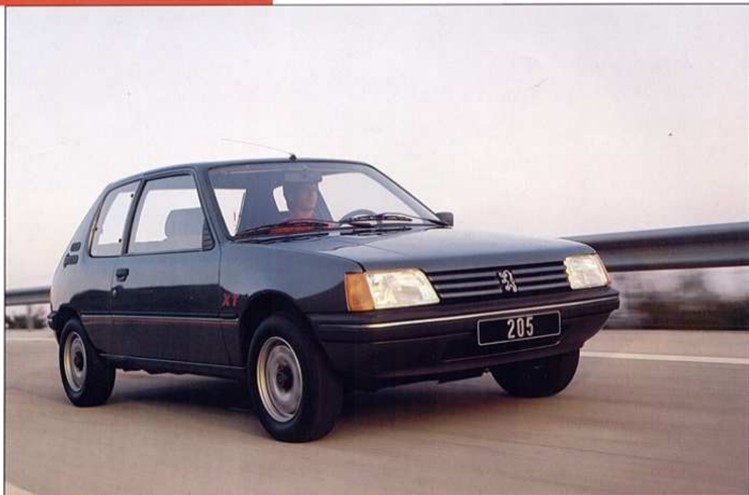
Modèle présenté : 205 XR