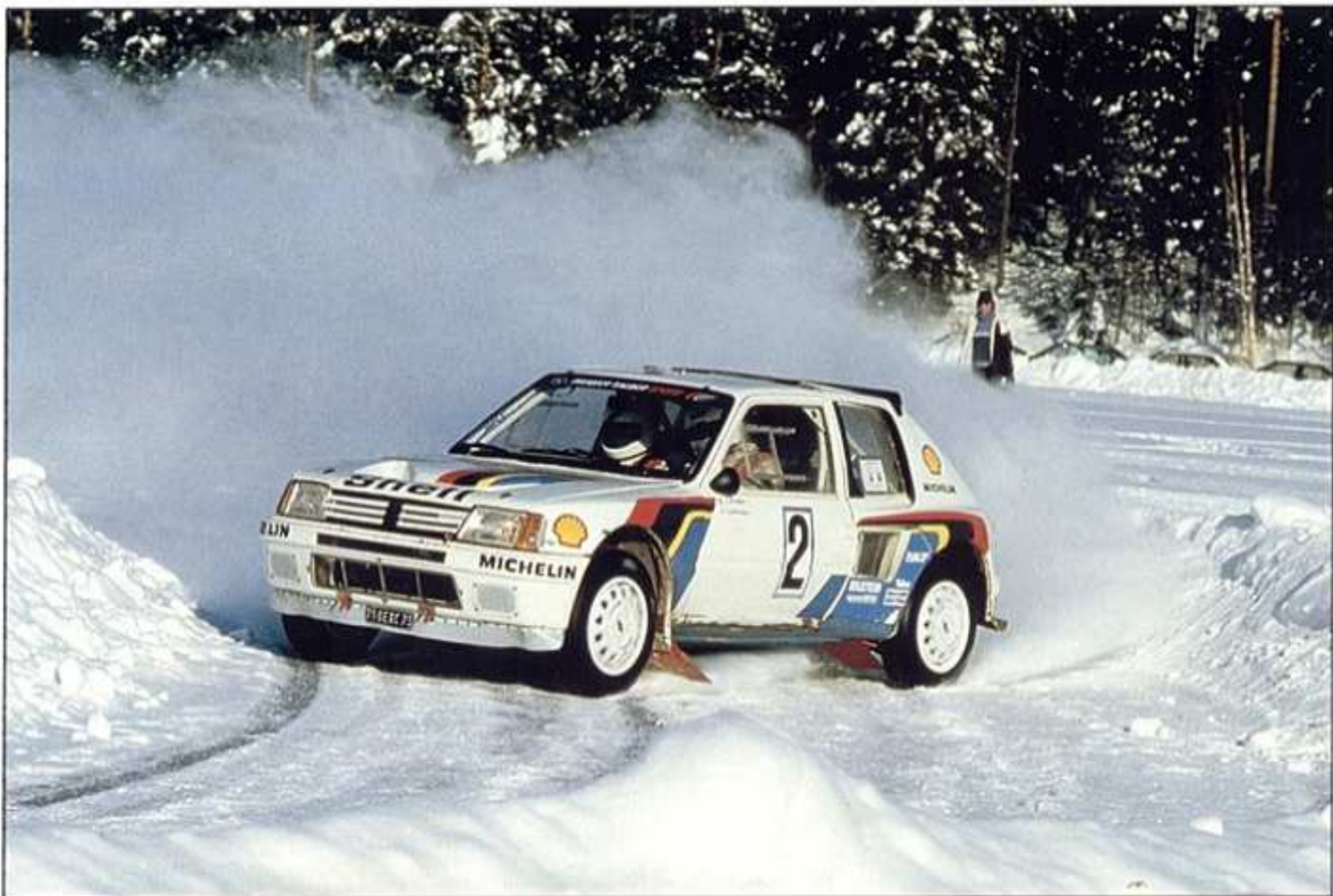
Rallye de Suède