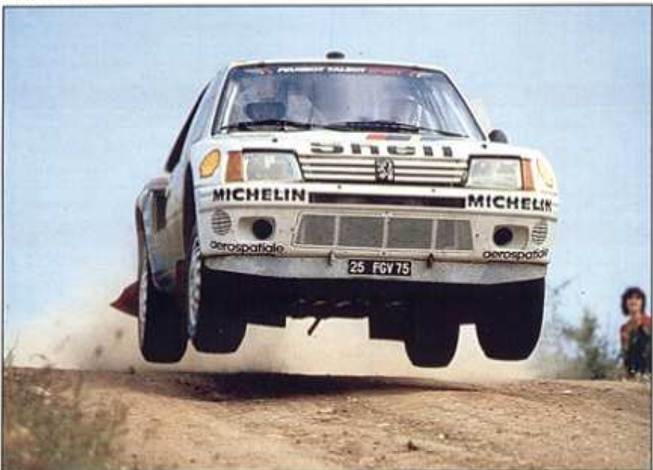
Rallye de l'Acropole.

La 205 GTI a de qui tenir. Sa sœur, la 205 Turbo 16, fait la loi en compétition. Alors, la 205 GTI se déchaîne à son tour. 105 ch DIN sous le pied, 100 km/h en 9,5 secondes, 190 km/h sur circuit, les arguments sont convaincants.