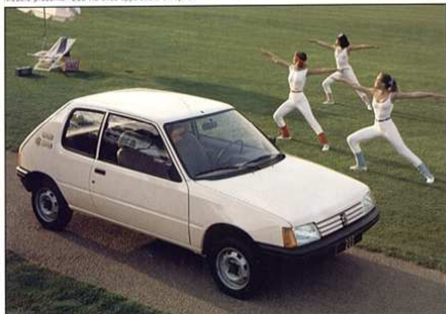
Modèle présenté : 205 XE avec appuis-tête en option