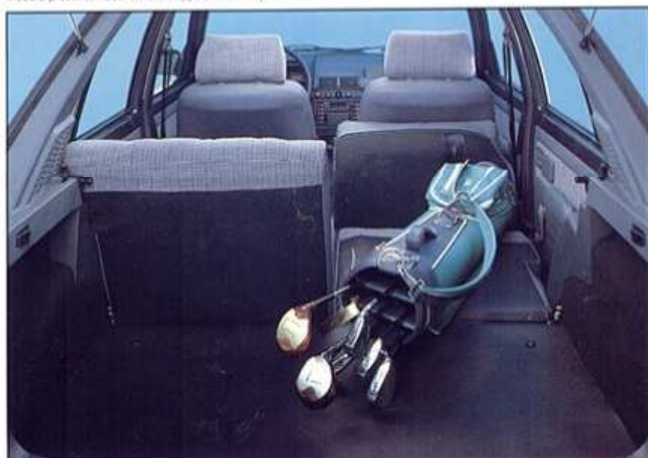
Modèle présenté : 205 SR