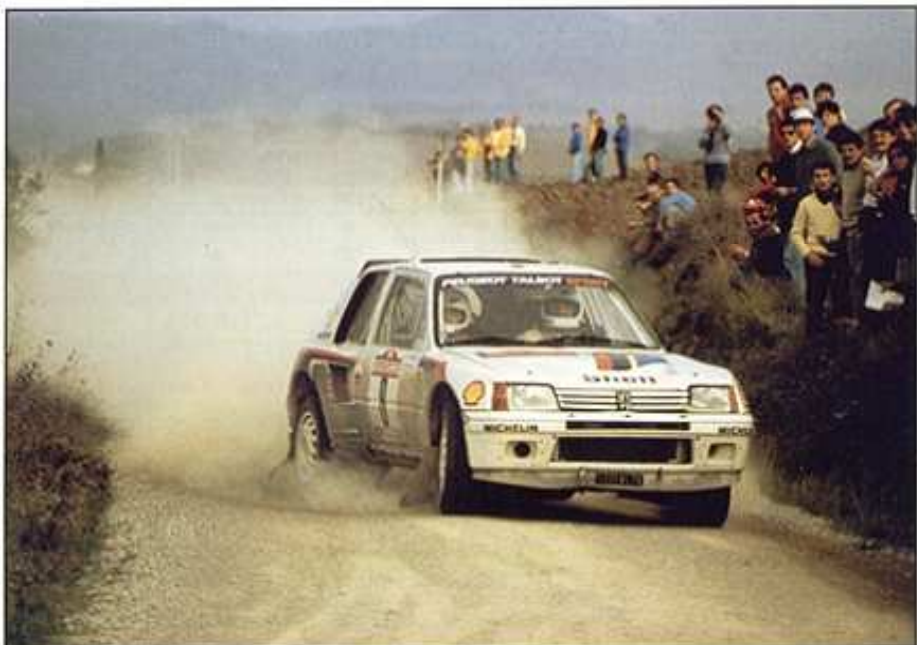
Rallye de San Remo.