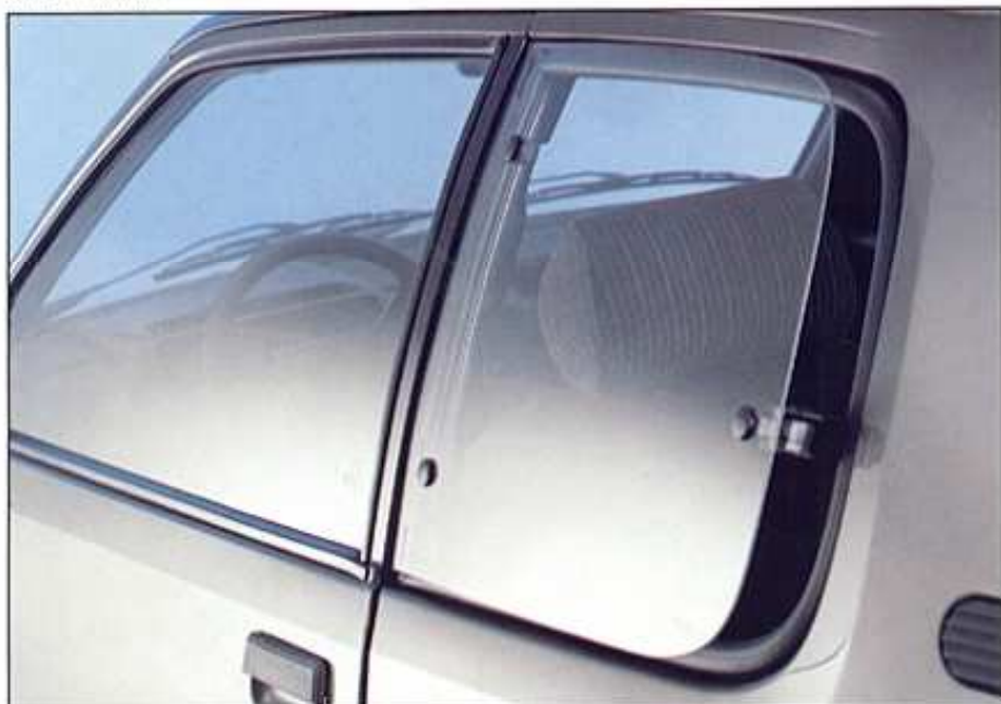
Vitres latérales arrière entrouvrables en option (XT / GTI)

3 ou 5 portes, la 205 est belle. Belle comme un galet d'acier et de verre. L'équilibre des volumes, la souplesse des courbes, ne laissent rien deviner de la bataille menée pour l'aérodynamisme. Spoiler avant et face avant étanches ont bien facilité les choses. Le résultat est un Cx de 0,35. Compacte sans être pataude, fluide sans mollesse, la 205 est aussi agréable à l'œil que plaisante à conduire.