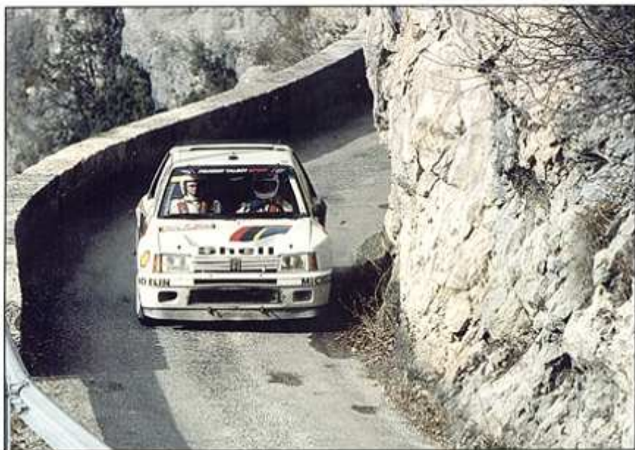
Tour de Corse.