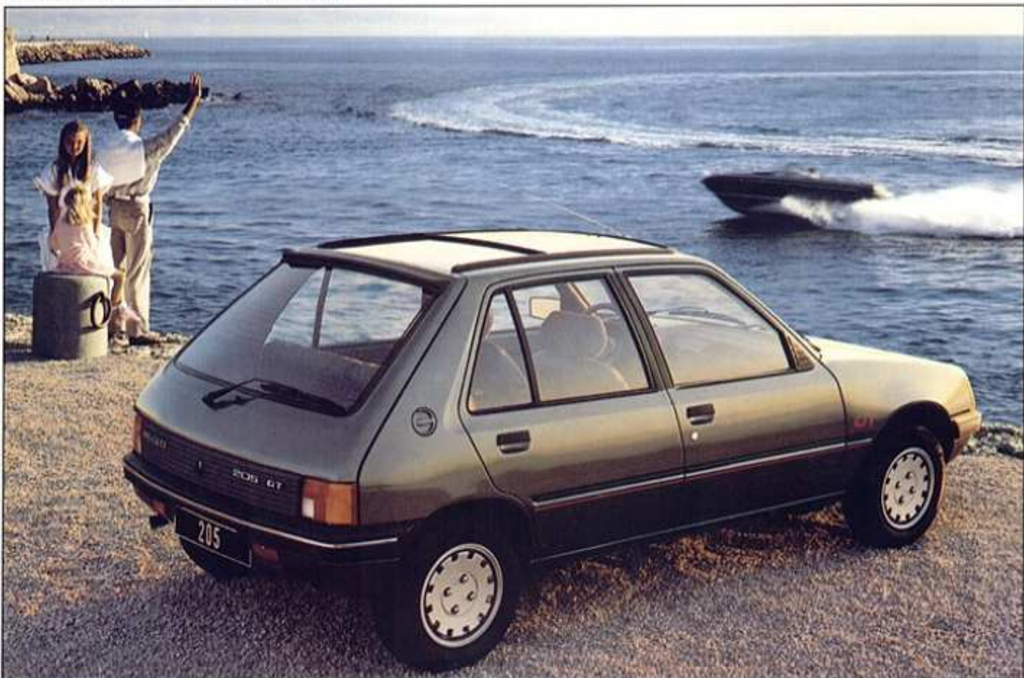
Modèle présenté : 205 GT avec jantes en alliage léger et toit ouvrant en option.