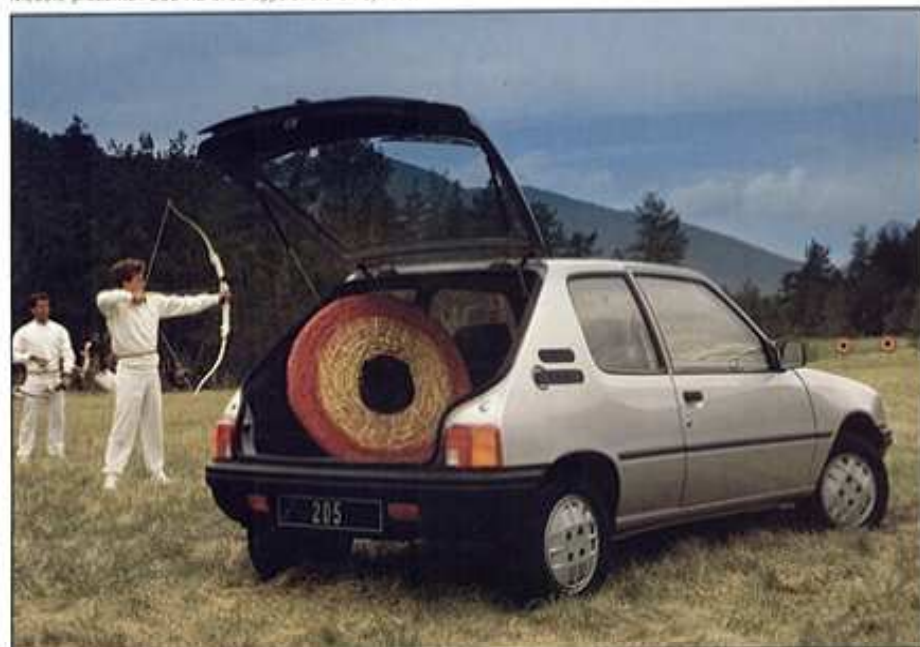
Modèle présenté : 205 XRA

De la 205 XA/XAD - la nouvelle classe affaires - à la 205 XT (170 km/h sur circuit), la 205 3 portes propose ses 10 versions, essence et Diesel, boîte 4 et 5 vitesses. Quel que soit le modèle, la 205 3 portes est une voiture amusante, sympathique, qui prend plaisir à filer et à se faufiler, une voiture décontractée, aussi à l'aise sur route qu'en ville.