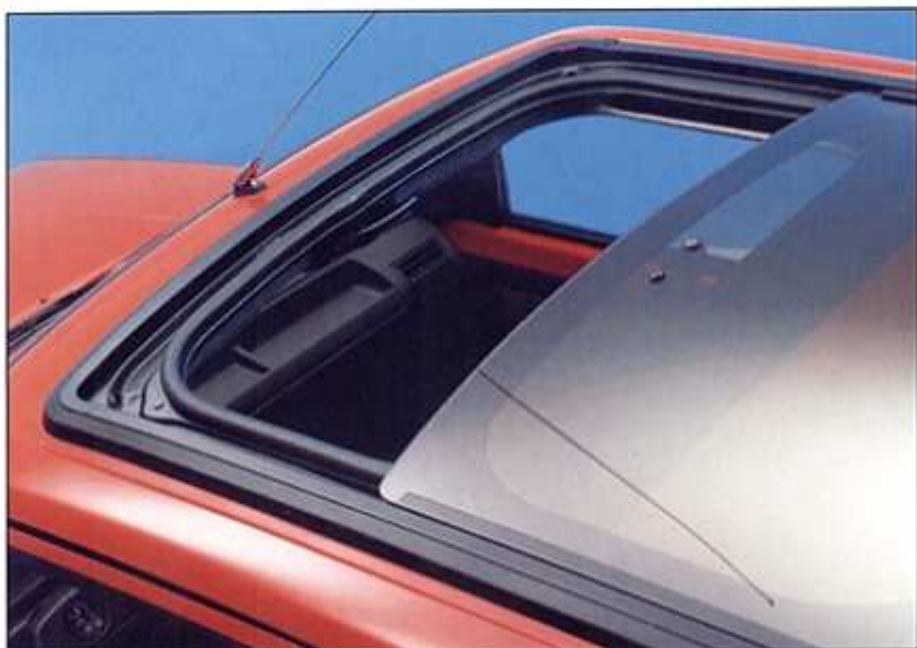
Option toit ouvrant