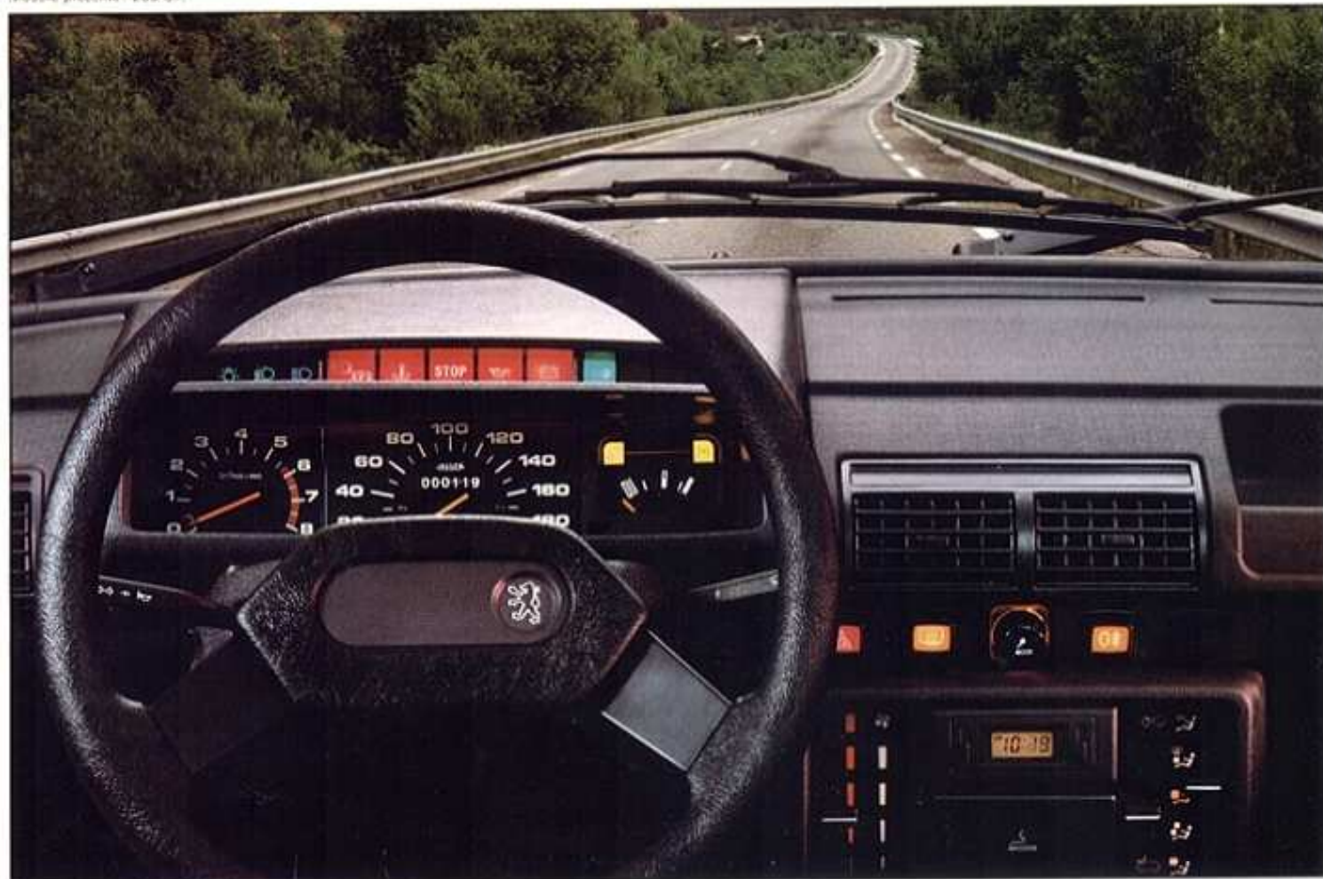
Modèle présenté : 205 XT/GT.