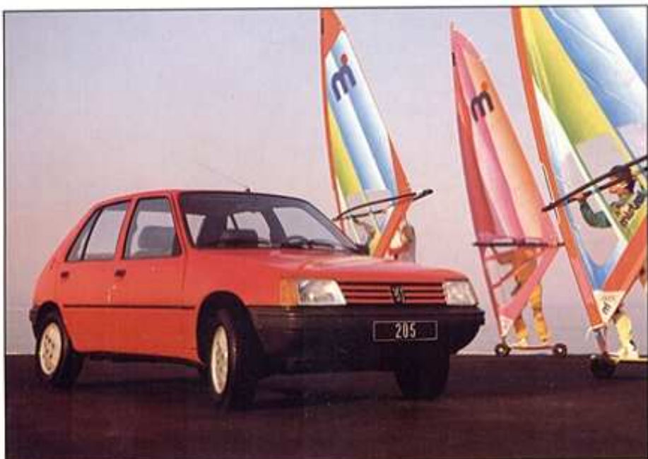
Modèle présenté : 205 GR