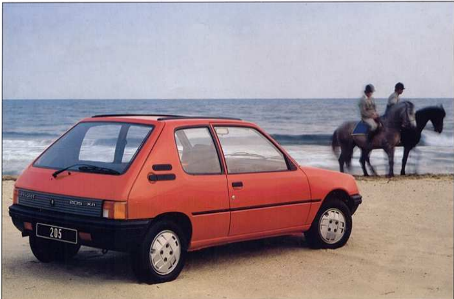
Modèle présenté : 205 XR avec toit ouvrant en option