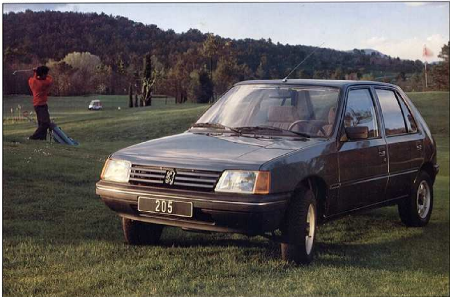
Modèle présenté : 205 SR