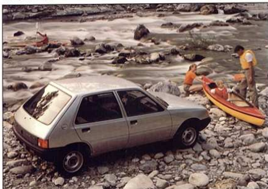
Modèle présenté : 205 GL avec appuis-tête en option.

De la 205 GL/GLD, maniable et débrouillarde à la brillante 205 GT (170 km/h sur circuit) en passant par les 205 GR et GRD, l'équilibre, et les 205 SR/SRD, le raffinement, les 205 5 portes sont 9. 9 façons de prendre la route, et aussi la ville et l'autoroute, en se faisant plaisir.