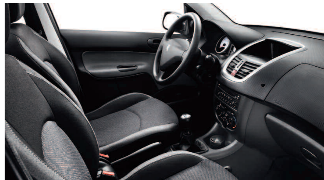
Chaîne et trame Pacifio Noir Bleuté