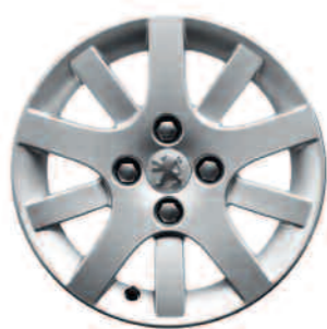
Jante aluminium 15\"/>

*Disponible en option selon les versions.