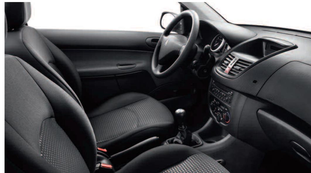
Maille Chekmate Mistral

*Disponible en option selon les versions.