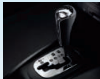
Boîte de vitesses automatique.

*Europe 14 pays – source A.A.A. - mars 2009