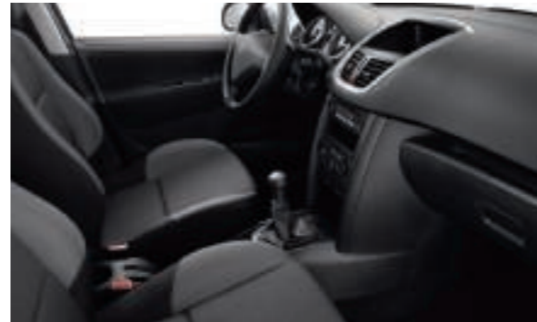
Chaîne et Trame Chilico Noir Mistral Disponible en série sur Berline Active et SW Active