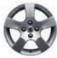
Jante Canberra 16 (5)