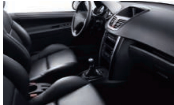
Option Cuir Perforé Noir Mistral (1) Disponible sur Berline et SW, selon les versions