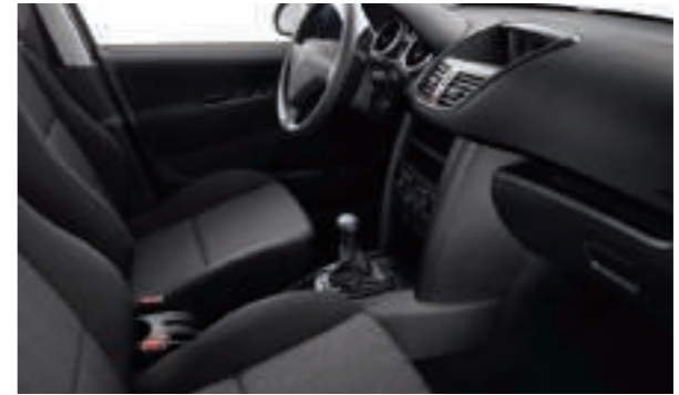
Chaîne et Trame Savana Noir Mistral Disponible en série sur Berline Urban