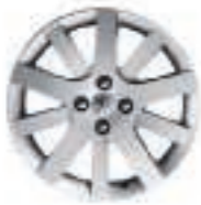
Jante Hockenheim 17 (4) (jante non chaînable)