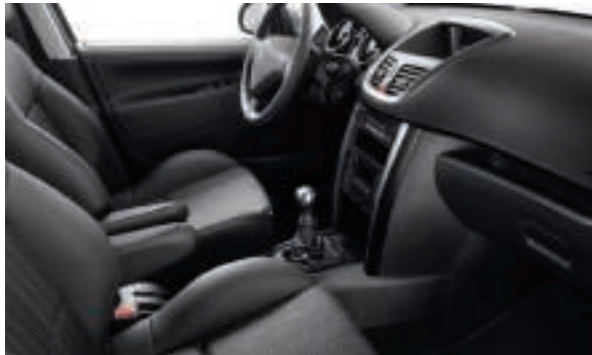
Mi-cuir Salsa Noir (2) Disponible en série sur Berline Féline