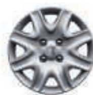
Enjoliveur Brisbane 15 (2)