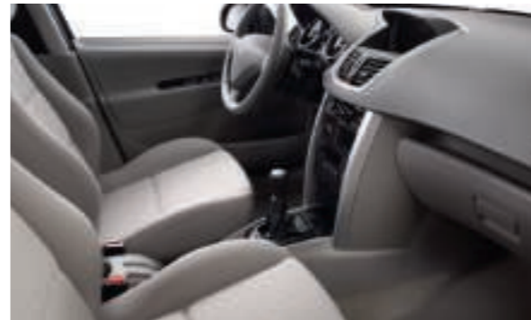
Chaîne et Trame SPA Grège Disponible en série sur Berline Premium 5 portes