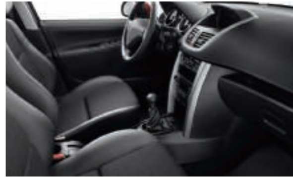
Maille Méilla Noir Disponible en série sur SW Outdoor