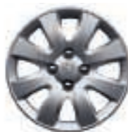
Enjoliveur Hobart 15 (1)