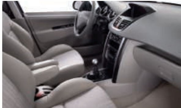
Mi-cuir Salsa Grège (2) Disponible en série sur Berline Féline 5 portes