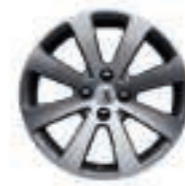
Jante Melbourne 17 (6) (jante non chaînable)