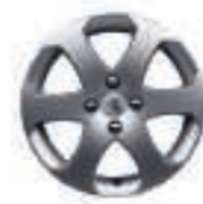
Jante Outdoor 16 (7) (jante non chaînable)