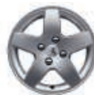
Jante Monaco 15 (3)