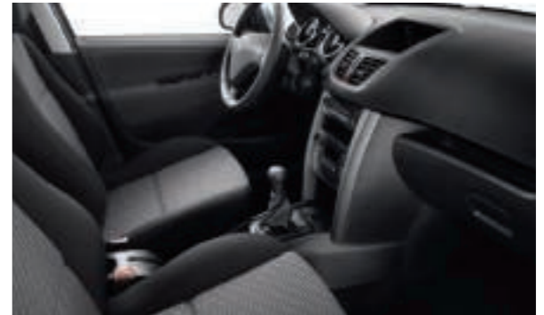
Chaîne et Trame SPA Noir Mistral Disponible en série sur Berline Premium et SW Premium