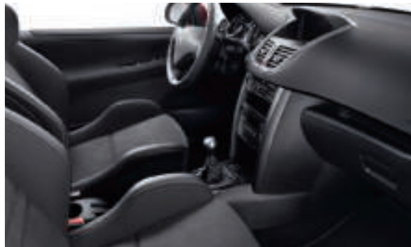
Sièges baquets trimatière Alcantara® Noir Disponible en série sur 207 RC