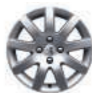
Jante Estoril 16 (4)