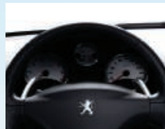
Palettes de changement de vitesses disponibles avec la boîte 2-Tronic (BVM5).