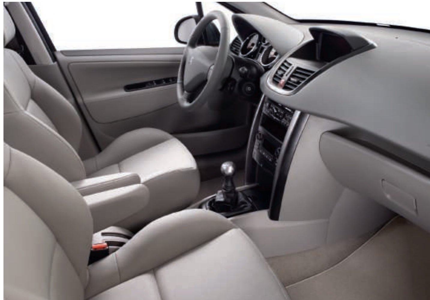
Option Cuir Perforé Grège (1) Disponible sur Berline Féline 5 portes