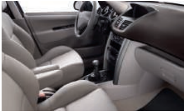
Option Cuir Perforé Grège Criollo (1) Disponible sur SW Outdoor