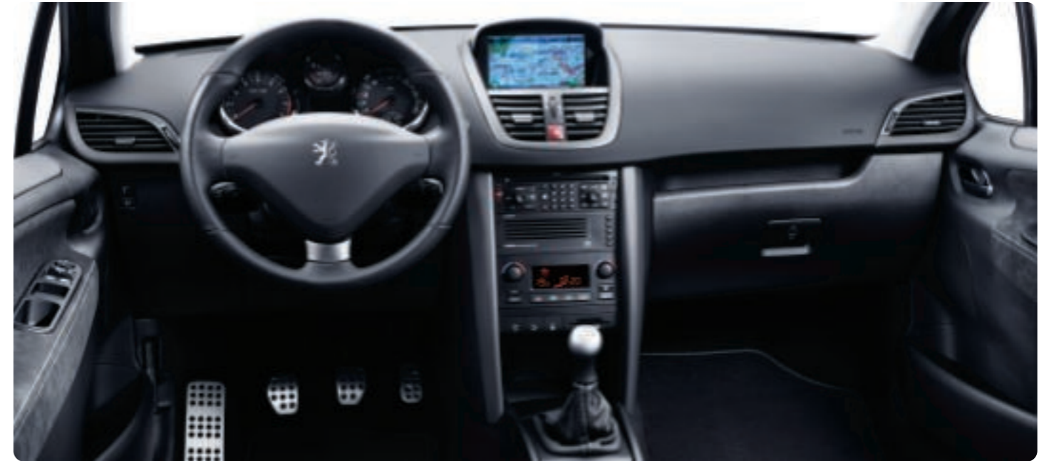
Véhicule présenté avec option RT3 couleur et chargeur 5 CD