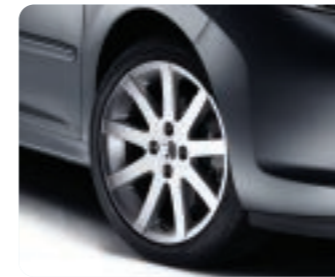
Jante aluminium Pitlane 17" (Non chaînable)