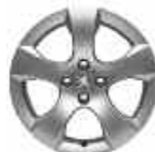
Jante alliage 17" SAVARA