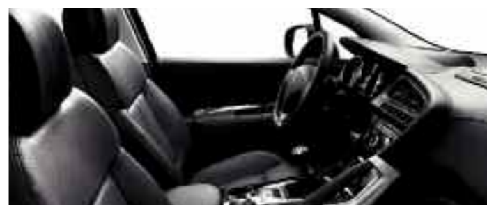
Cuir intégral Tramontane*