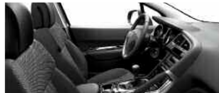
Chaîne et trame Sibayak Tramontane