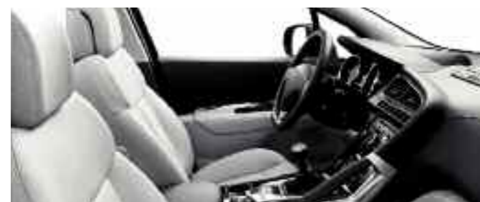
Cuir intégral Guérande*