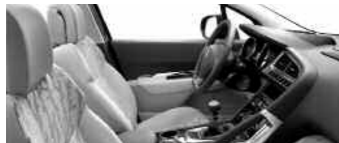
Chaîne et trame Ombrage Guérande