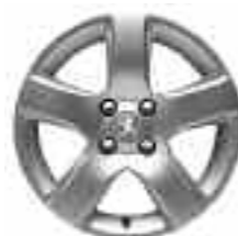
Jante alliage 16" ISARA Associée exclusivement au Grip Control® (en option). Motricité renforcée.