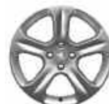
Jante alliage 18" EXONA