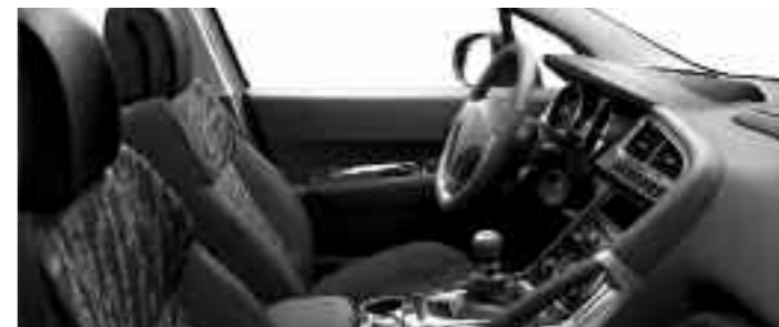
Chaîne et trame Ombrage Tramontane