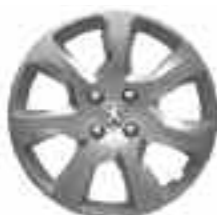
Enjoliveur 17" ATAX