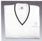
▲ Pull blanc tennis