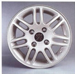
▲ Jante en alliage