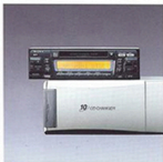
▲ Poste radio CD avec chargeur