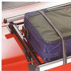
▲ Galerie de coffre