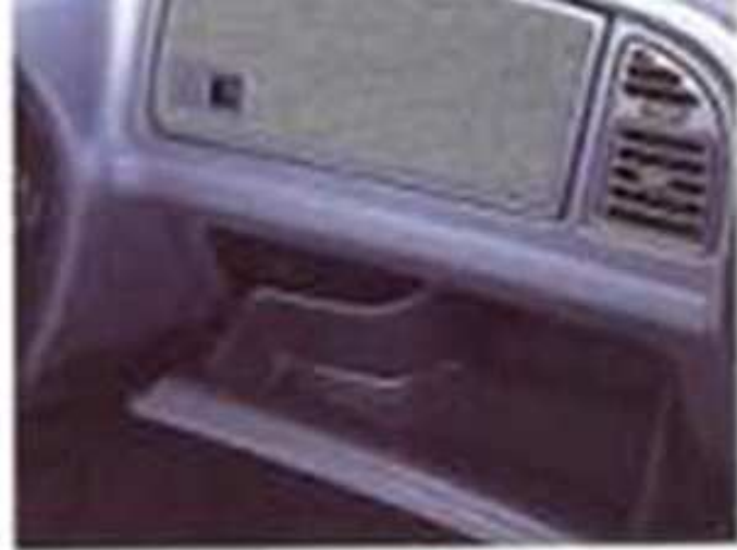
Boîte à gants et vitres-pecches avec porte