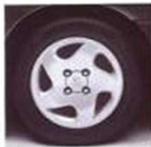
Jantes en alliage léger (option)