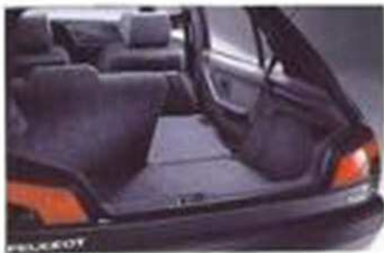
Coffre avec éclairage et banquette arrière rabattible en 2 parties 23-13