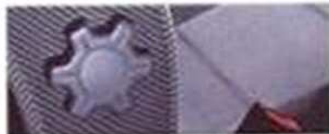
Réglage lombaire du siège conducteur (série)