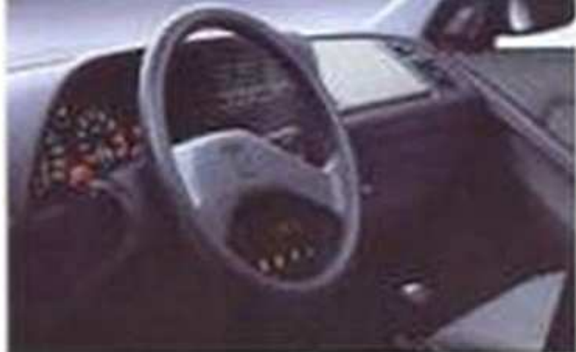
Puante de conduite