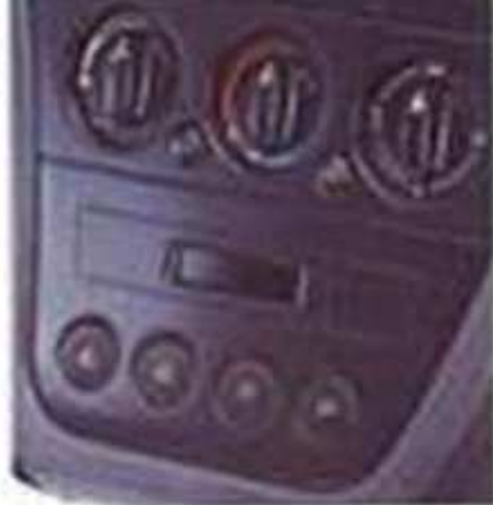
Air conditionné avec régulation de température (option)