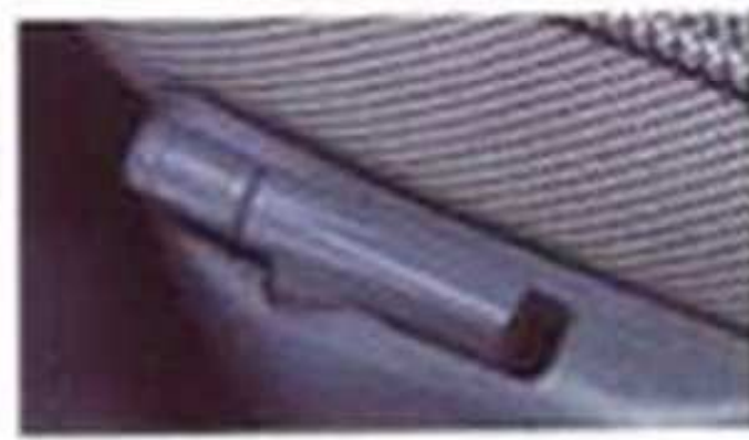
Réglage en hauteur du siège conducteur (série)