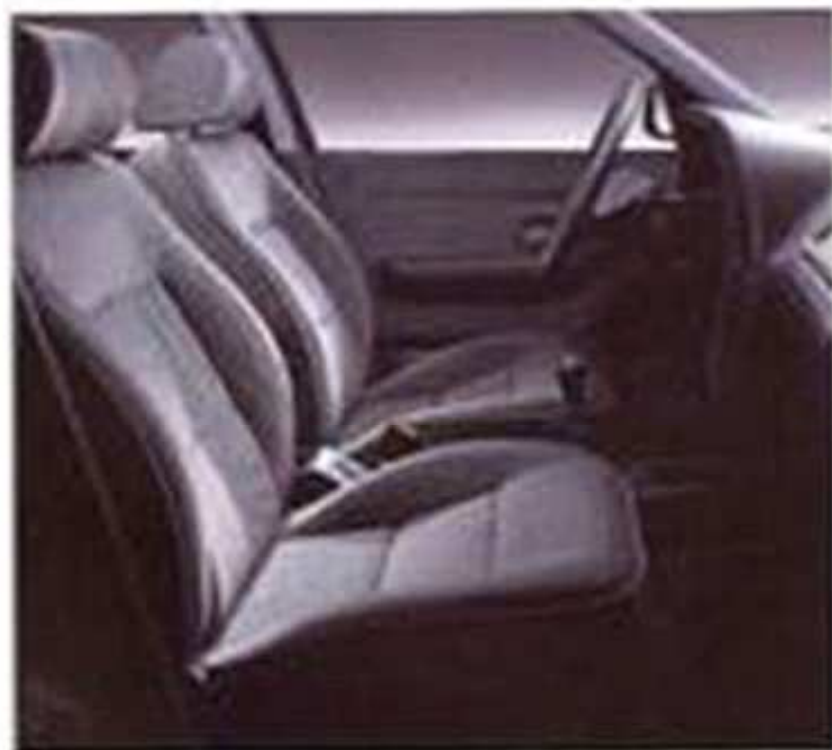
Sièges avant garnis de cuir et dossier inclinable et appui-tête réglable