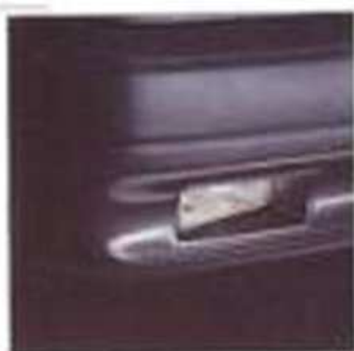
Foix antibrouillard (option)