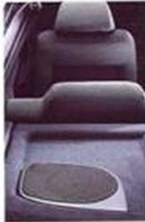
Fond portière munie de grilles (option)