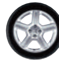
CHALLENGER 17 pouces (roue non chaînable)