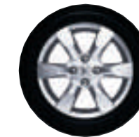
EQUINOXE 16 pouces