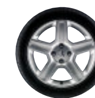
Jante en alliage léger 17" Challenger*