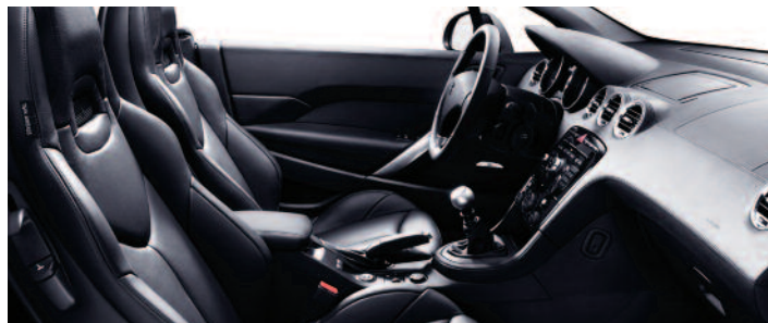
Cuir intégral Claudia Noir Mistral