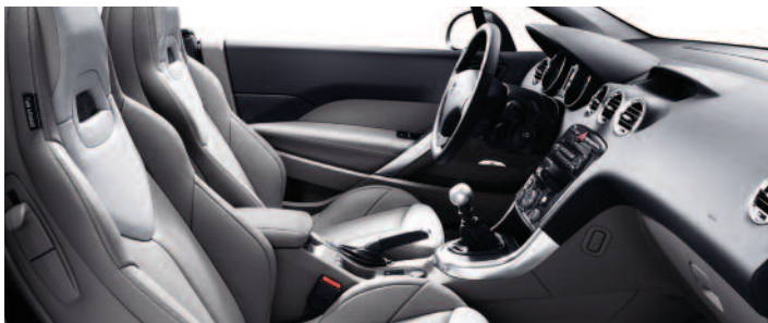
Cuir simple Claudia Grège/Lama

Pour le détail des garnissages cuir et cuir intégral, consulter le document "Tarif, Equipements et Caractéristiques Techniques"