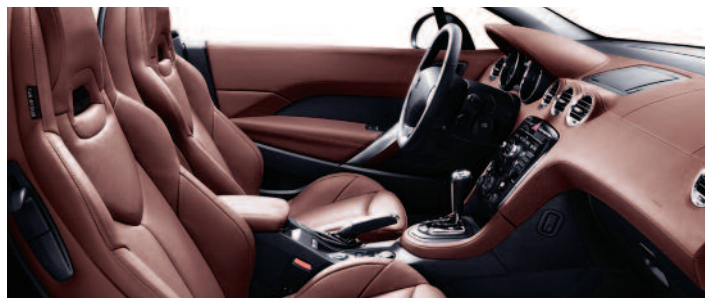
Cuir intégral Claudia Vintage