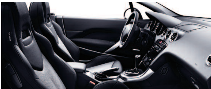
Maille Speed-up Noir/Gris

Pour le détail des garnissages cuir et cuir intégral, consulter le document "Tarif, Equipements et Caractéristiques Techniques"