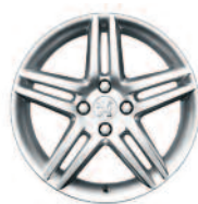
jante aluminium STROMBOLI 17"