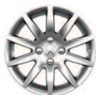
jante aluminium IZALCO 16"