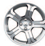
jante aluminium LINCANCABUR 18"