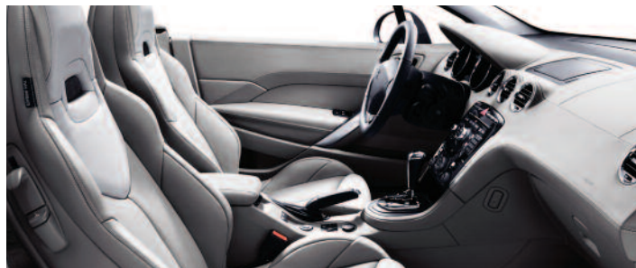
Cuir intégral Claudia Grège/Lama