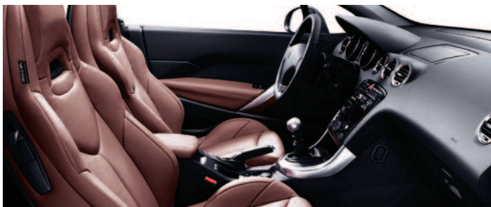
Cuir simple Claudia Vintage