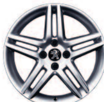
Jante aluminium Stromboli 17"