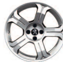
Jante aluminium Lincancabur 18"