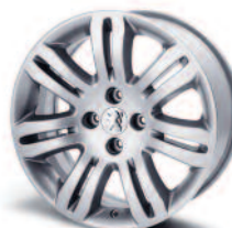
Jante alliage Kapsiki 17"