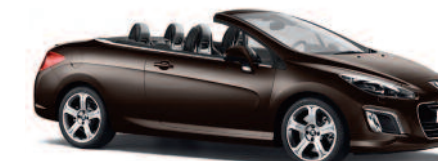
Brun Guaranja (Disponible à partir de fin 2011)