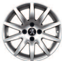
Jante aluminium Izalco 16"