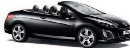
Noir Perla Nera