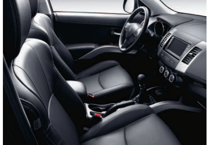
Garnissage cuir Dulce Astrakan (1)