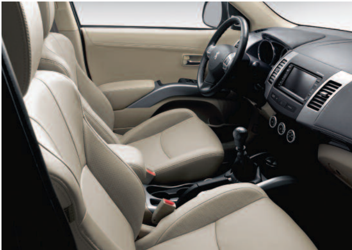
Garnissage cuir Dulce beige (1)