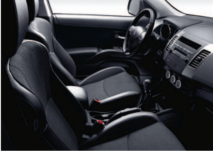
Garnissage tri-matière chaîne et trame Diamant (1)