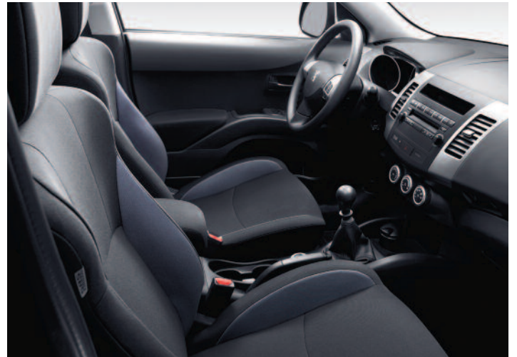
Garnissage Knit (1)