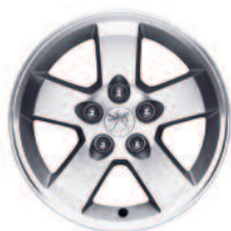
Jante alliage 16" Manyara