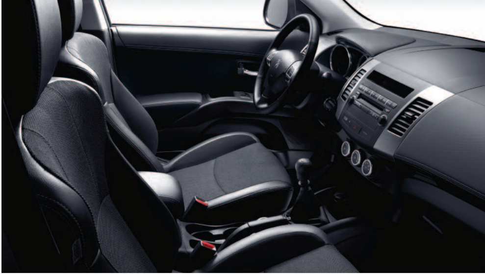
Garnissage tri-matière chaîne et trame Diamant (1)