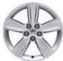
Jante 18" Tanganiyka