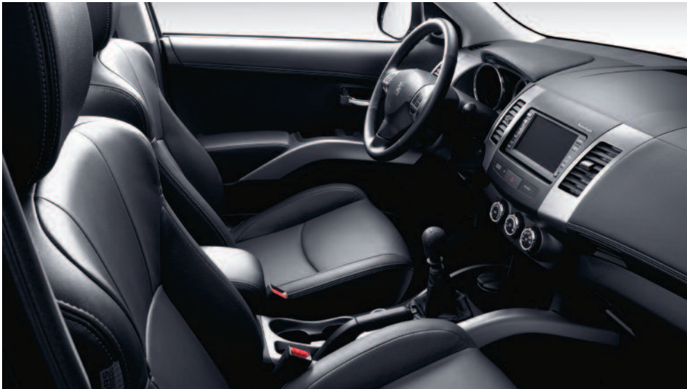
Garnissage cuir Dulce Astrakan (1)