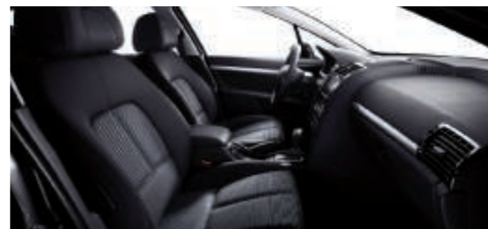
Tressé Andorre Bleuté