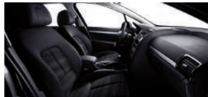
Chaîne et Trame Figue