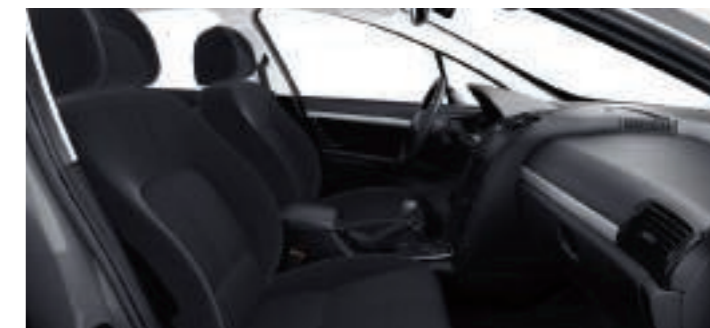
Chaîne et Trame Velouré Trad Tramontane