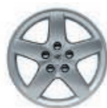
Jante aluminium Quasar 16 (4) ou 17 (4)