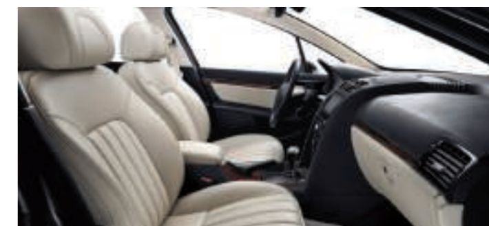
Cuir Terre de Cassel**