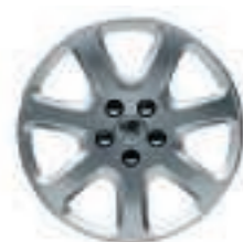
Enjoliveur Andante 16 (3)