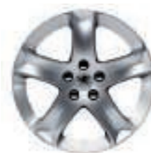
Jante aluminium Cosmos 17 (4)