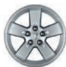
Jante aluminium Hortaz 16 (3)