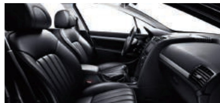
Cuir Noir Mistral**