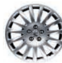
Jante aluminium Soleil 18 (5)