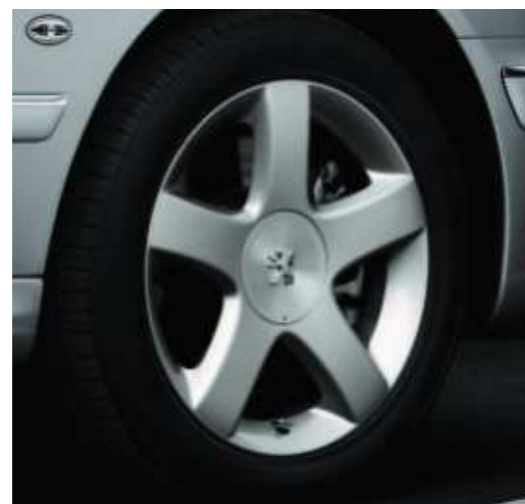
Jante Tosca 17" en option suivant stock disponible