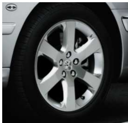
Jante Nabucco 17" de série