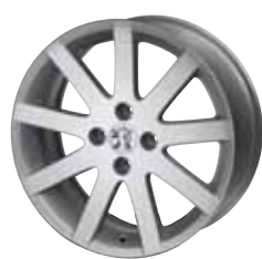
Roue alliage 17" Pitlane