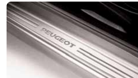
Protecteurs de seuils de portes inox Jeu de protecteurs en inox pour l'esthétique et la protection des bas de marche.