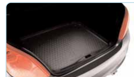
Bac de coffre Très facile à manipuler, ce bac en matériau thermoformé se pose dans le coffre sans se fixer. Il en épouse les contours et le protège de toutes parts.