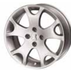
Roue alliage Eveyans 17"