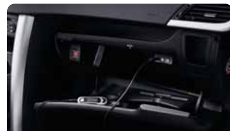
Prise auxiliaire audio Profitez pleinement de votre baladeur CD ou de votre lecteur MP3. Grâce à cette prise, vous bénéficiez d'une qualité sonore optimale.