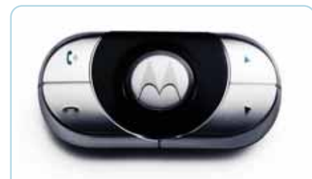
Kit mains-libres Bluetooth Gardez les mains sur le volant et conversez tout en laissant votre portable GSM compatible Bluetooth® dans votre poche.