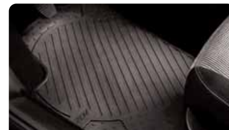
Surtapis avant en caoutchouc noir Pour une bonne tenue au sol, ces surtapis épousent les formes du plancher de votre 207 CC. En caoutchouc, ils sont résistants et facile d'entretien.