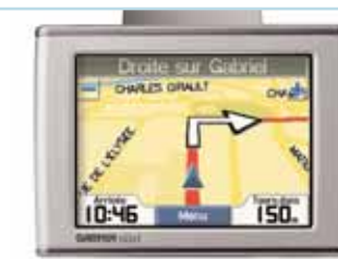
Système de guidage nomade Entrez votre destination à l'aide de l'écran tactile et laissez-vous guider partout en France.

Coupé un instant, cabriolet l'instant d'après, 207 CC est l'image même des progrès de la technologie automobile. Profitez pleinement de cette avance avec des équipements qui vous aident à vous concentrer sur l'essentiel : la conduite.