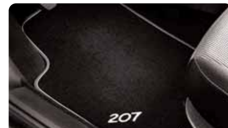
Surtapis Reflex gris Mistral Fabriqués sur mesure, ces surtapis en velours tufté épousent la forme du plancher en venant se clipper simplement sur les fixations existantes.