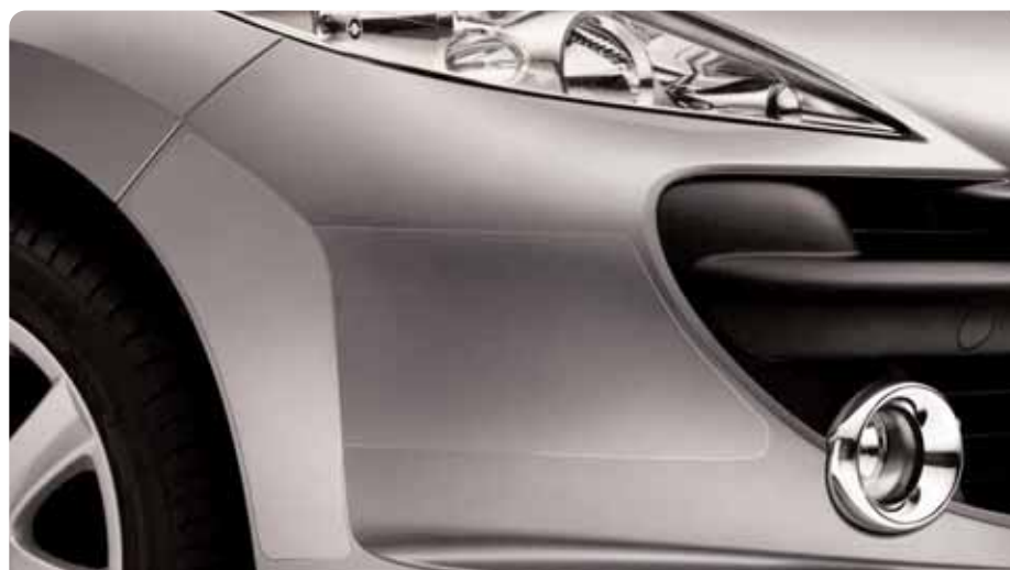
Kit protecteurs adhésifs Réalisé à partir d'un film adhésif transparent, ce kit apportera une protection efficace contre les projections de gravillon, griffures, rayures de stationnement.

Pneus hiver Les pneumatiques hiver sont parfaitement adaptés à la conduite hivernale tout temps. Modèle de roue non représentatif.