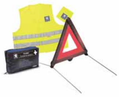
Accessoires sécurité Éléments indispensables et obligatoires dans certains pays, ces accessoires vous seront d'une aide précieuse en cas d'aléas pendant vos trajets.