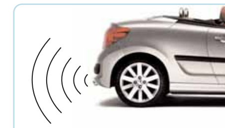
Aide sonore au stationnement arrière Discrets, ses capteurs de proximité intégrés dans le pare-chocs arrière vous seront d'une aide précieuse lors de vos manœuvres en marche arrière.