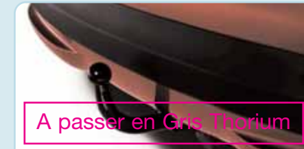
A passer en Gris Thorium

Adaptez votre 207 CC à toutes les circonstances avec ces accessoires qui rendent encore plus pratique sa nature voyageuse. Avec eux, vous allez vivre vos loisirs dans les meilleures conditions.