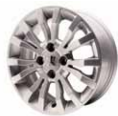
Roue alliage 16" Chrono

Dessinées en intégrant les spécificités de 207 CC, ces roues en alliage léger affirment sa personnalité, tout en offrant toutes les garanties en matière de qualité, sécurité et tenue de route.