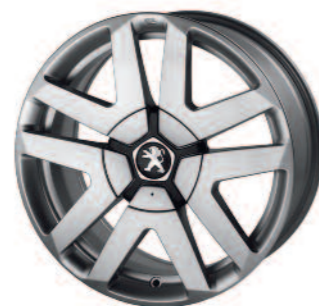
Jante alliage Oltis 17" Réf : 5402 FG Réf : 16074883 80 le jeu de 4