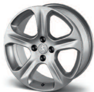
Jante alliage Exona 18" Réf : 5402 Z1

Les jantes en alliage léger occupent une place privilégiée pour renforcer le style et personnaliser votre véhicule. Livrées sans vis, ni cabochon.