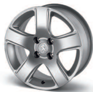
Jante alliage Isara 16" Réf : 5402 Y4 Réf : 16063945 80 le jeu de 4