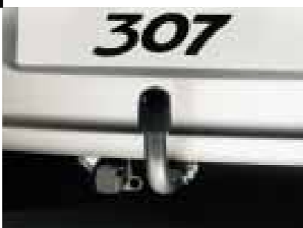
» Attelage à rotule col-de-cygne