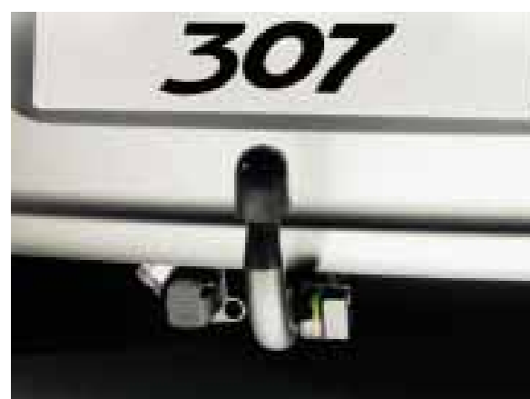
» Attelage à rotule démontable sans outil

Comment prendre des kilos tout en gardant la ligne ?