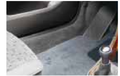
» TAPIS VELOURS BLEU

Ce jeu de surtapis de qualité VEGA comprend quatre pièces en moquette aiguilletée de couleur gris chiné, à finition surjetée. Marqués du monogramme 307, ils assurent une excellente protection de la moquette d'origine.