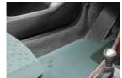
» TAPIS VELOURS VERT