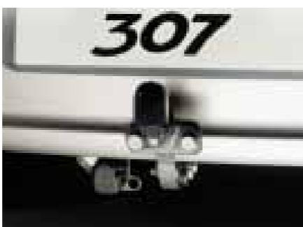
» Attelage à rotule monobloc