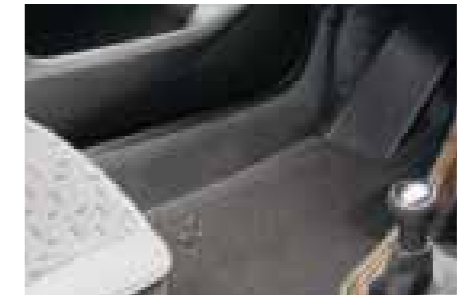
» TAPIS VELOURS GRIS