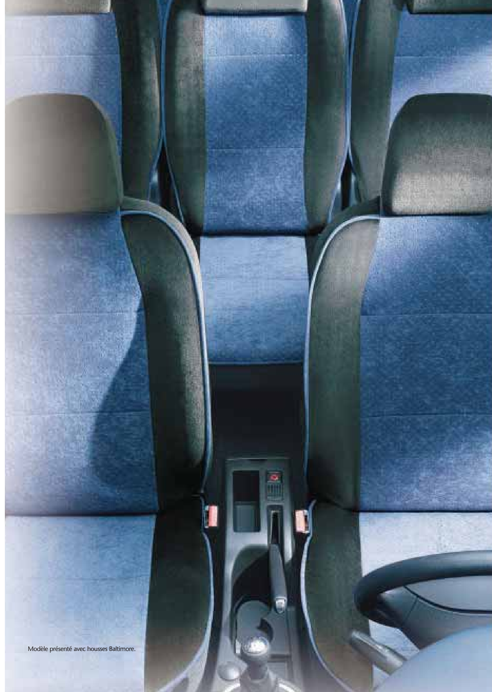
Modèle présenté avec housses Baltimore.

Dessinées exclusivement pour votre 307 SW, les housses Baltimore en velours microfibre (bleu et noir ou vert et noir) très doux sont élégantes, de grande qualité, et offrent une forte résistance à l'ensoleillement, aux frottements et à l'humidité. Chaque jeu comprend les housses pour les deux sièges avant (avec ou sans accoudoir) et les 3 sièges arrière. Elles respectent l'emplacement des tablettes avion, sont compatibles avec les airbags latéraux et sont pourvues de vide-poches au dos des deux sièges avant. 307 SW vous propose également les housses Calipso et les housses Ouvéa. Il existe également une housse pour un siège de 3 ème rangée.