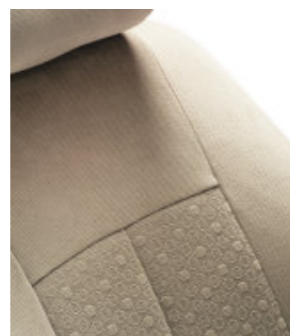
Housses Yonis Beige*

Stockholm Gris : le marbré du tissu donne un aspect soyeux à ce jeu de housses en velours microfibre perforé avec un accompagnement uni.