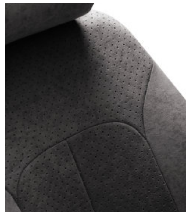
Housses Stockholm Gris