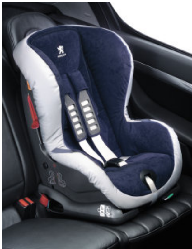
Isofix Duo Plus

* Le système Isofix permet au siège de se fixer directement sur les ancrages ISOFIX du véhicule pour un maintien renforcé.