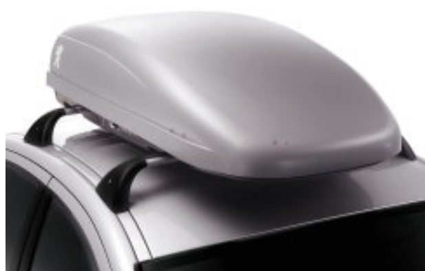
Coffre de toit

Conçu en fonction des barres de toit 407, il dispose d'un système de fixation spécifique. Verrouillable, pourvu de supports en caoutchouc antidérapant, il permet de transporter 4 à 5 paires de skis.