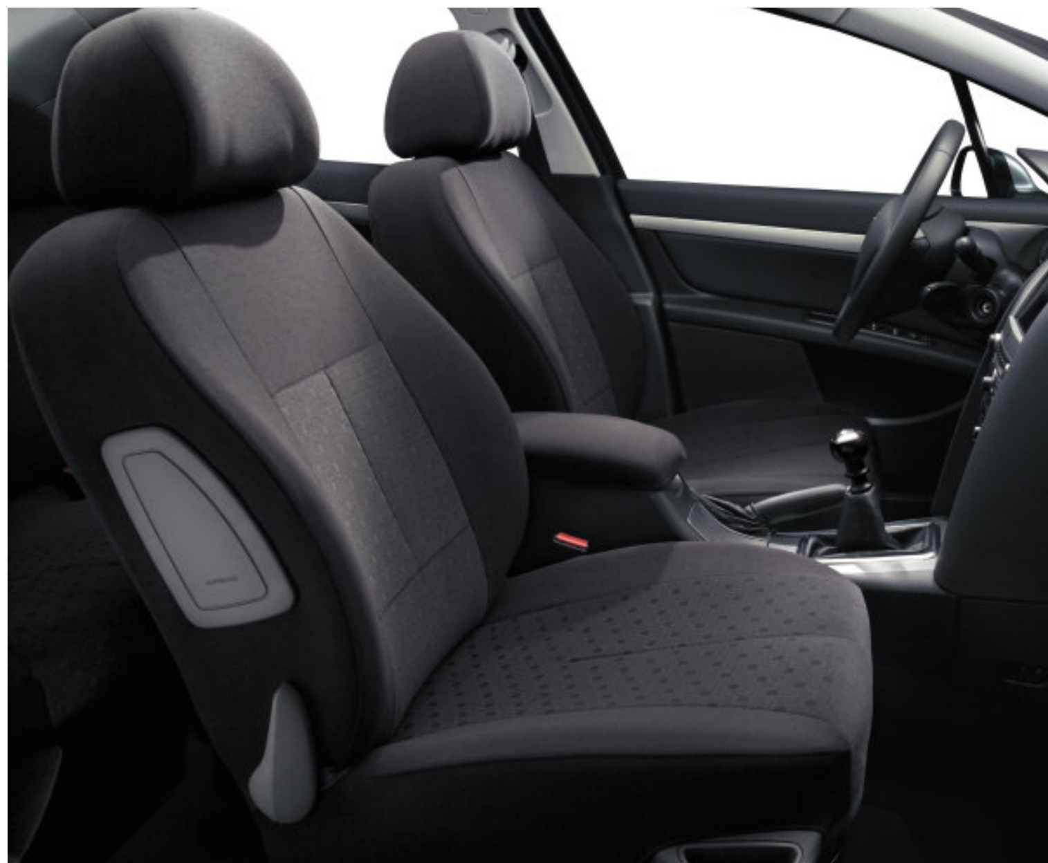
Housses Yonis Gris*

intérieure du véhicule. Qui plus est, vous avez la garantie que ces housses vous offriront une grande satisfaction à l'usage. Les tissus dans lesquels ces housses ont été taillées ont en effet subi de nombreux tests qualité avant d'être sélectionnés par Peugeot.