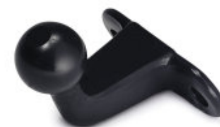
Attelage à rotule démontable