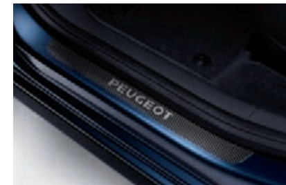
Protecteurs de seuil de porte aspect carbone

En PVC aspect carbone ou en inox, les protecteurs de seuil de porte de 5008 allient esthétique et protection des bas de marche.