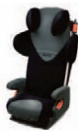
Recaro Start + Groupe : 2, 3