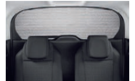
Store pare-soleil de lunette arrière