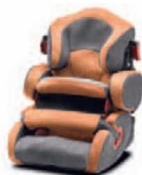
Kiddy Life + Groupe : 1, 2, 3 Groupe 1 avec le bouclier présenté et vendu séparément.