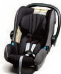
Romer Baby Safe + Groupe : 0

Une gamme de sièges adaptés au transport des enfants de la naissance à 10 ans pour offrir un confort optimal. Testés et homologués, ils répondent aux normes de sécurité les plus strictes (Homologation européenne ECE R44/03).