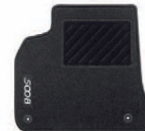
Tapis moquette aiguilleté