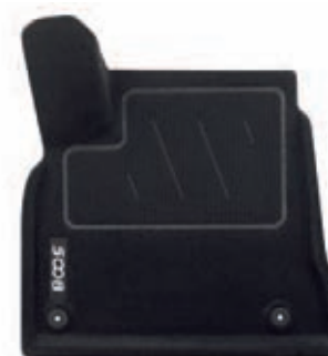
Tapis en forme

grand choix. De plus, pour un positionnement précis, le tapis conducteur se clippe sur les fixations existantes.