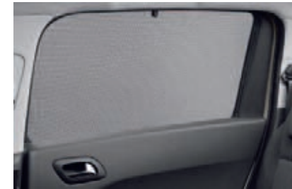
Store pare-soleil latéral

Encastrables, ils favorisent la protection des passagers contre les rayons du soleil en occultant les vitres des portes arrière.