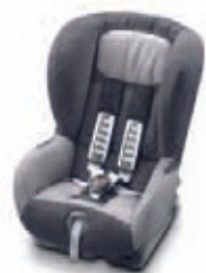
Isofix 3 points Romer Duo + Groupe : 1