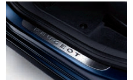
Protecteurs de seuil de porte inox