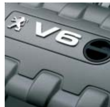
Essence : 2,0l BVA (Boîte de Vitesses Automatique autoactive) ; 2,2l et 3,0l V6 BVM (Boîte de Vitesses Manuelle) et BVA.

Grâce à une gamme complète de motorisations, le Coupé 406 tient toutes ses promesses de dynamisme. Essence ou diesel, chaque moteur conjugue vivacité et agrément. Associés à la boîte de vitesses automatique autoactive qui s'adapte à votre type de conduite, les moteurs 2,0l et 3,0l V6 procurent à chacun un confort remarquable. Le Filtre à Particules (FAP) équipant le moteur 2,2l HDi emprisonne les particules à l'origine des fumées noires émises par les moteurs diesel.