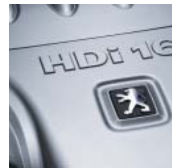
Diesel : 2,2l HDi BVM + Filtre à Particules (FAP).