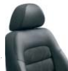
Cuir Ouragan et tissu Salzbourg.