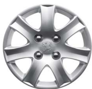
Enjoliveur SPA 14"