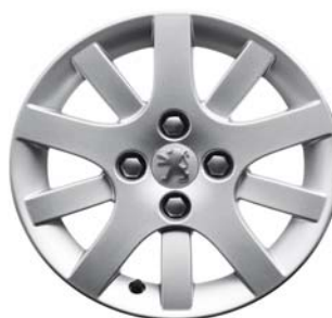
Jante Interlagos 15"