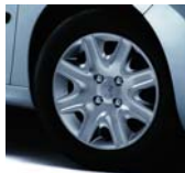
Enjoliveur Brisbane 15"