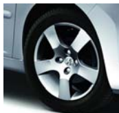
Jantes Canberra 16"