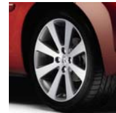
Jantes Melbourne 17"