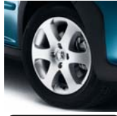
Jantes Outdoor 16"