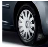
Enjoliveur Eagle 15"