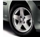
Jantes Monaco 15"