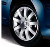
Jantes Estoril 16"