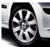
Enjoliveur Hobart 15"