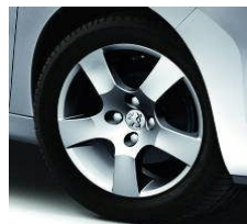
Jantes Canberra 16"