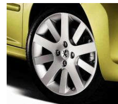
Jantes Hockenheim 17"