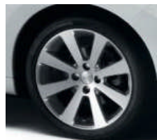
Jantes Melbourne 17"