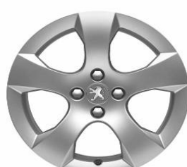
Jante alliage SAVARA 17"