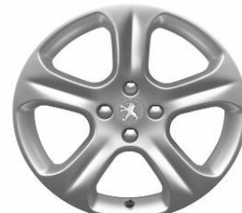
Jante alliage EXONA 18"