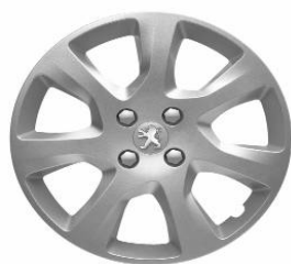
Enjoliveur ATAX 17"

Toutes les jantes de 3008 sont chaînables. Les jantes 17" et 18" sont chaînables avec jeux réduits.