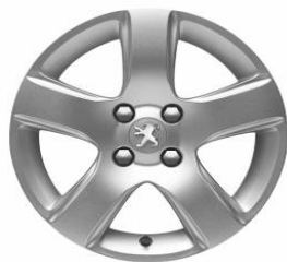
Jante alliage ISARA 16" (Uniquement avec option Grip Control)