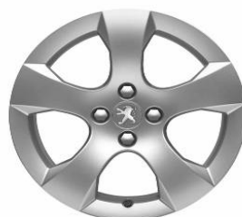
Jante alliage SAVARA 17"