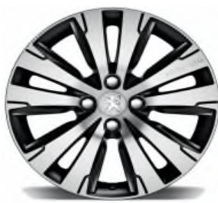
Jante alliage Diamantées et gravées SCALDIS 17" noires Onyx