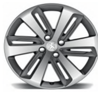
Jantes alliage Diamantée ICAUNA 18" gris Anthra