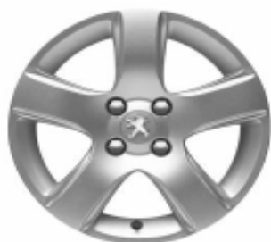
Jante alliage ISARA 16"