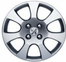
Enjoliveur Toliman 16"