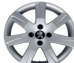
Jante alliage Santiagouito 2.16"