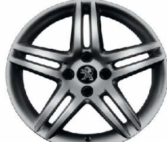
Jante alliage Stromboli Dark 17"