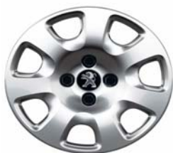
Enjoliveur Atacama 15"

** Option Gratuite sur Féline (inclus avec la prise d'option Roue de secours homogène alliage)