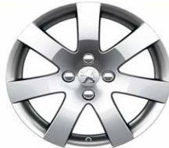
Jante alliage Santiagouito 1.16"