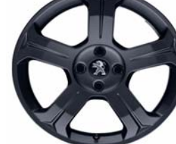
Jante alliage Licancabur 18" Dark Storm