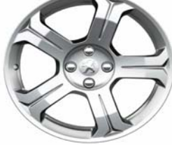
Jante alliage Licancabur 18"