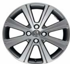
Jante alliage Melbourne 17"