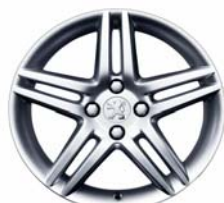
Jante alliage Stromboli 17"