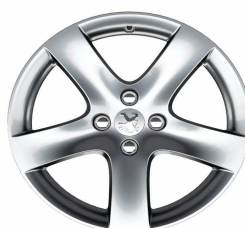
Jante alliage Rinjani 17"