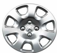
Enjoliveur Atacama 15"