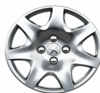
Enjoliveur Pacaya 15"