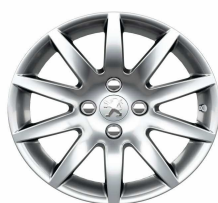
Jantes alliage Izalco 16"