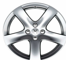
Jante alliage Rinjani 17"