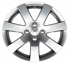
Jante alliage Santiaguito 16"