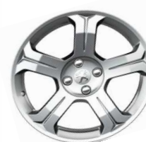
Jante alliage Lincancabur 18"