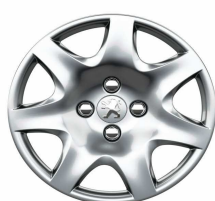
Enjoliveur Pacaya 15"