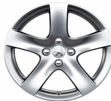
Jante alliage Rinjani 17"