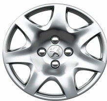
Enjoliveur Pacaya 15"