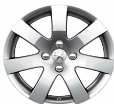
Jante alliage Santiaguito 16"