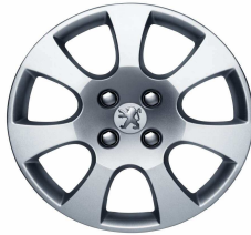
Enjoliveur Toliman 16"