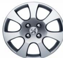
Enjoliveur Toliman 16"