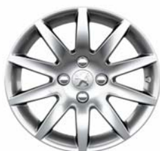
Jante alliage Izalco 16"