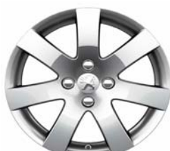
Jante alliage Santiaguito 16"