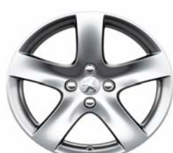
Jante alliage Rinjani 17"