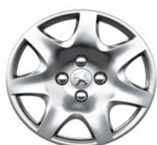
Enjoliveur Pacaya 15"