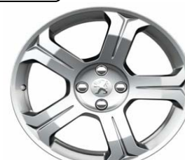
Jante alliage Lincancabur 18"