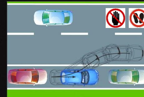
Full Park Assist