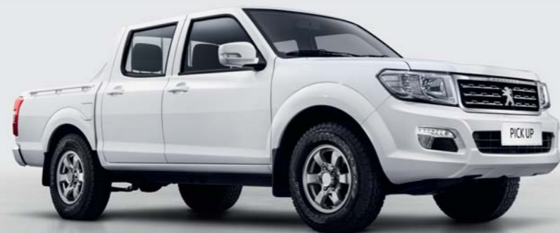
2 roues motrices Nordic White