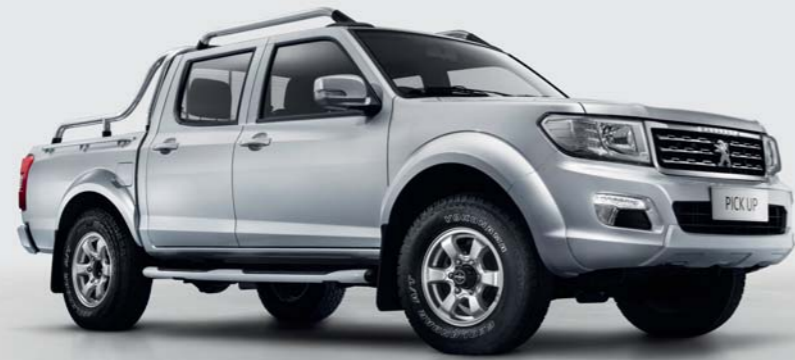
4 roues motrices Light Grey