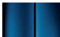
Réf. : COLOR_T6M0