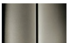
Réf. : COLOR_L8M0