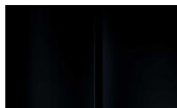
Réf. : COLOR_XYP0