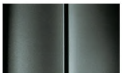
Réf. : COLOR_T5M0