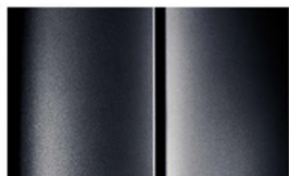
Réf. : COLOR_XP0