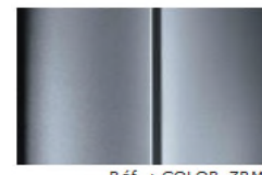
Réf. : COLOR_ZRM0