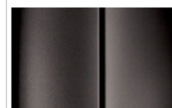
Réf. : COLOR_1SM0