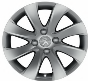
Jante Aluminium MANAGUA 16"