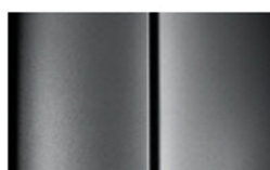
Réf. : COLOR_F4M0