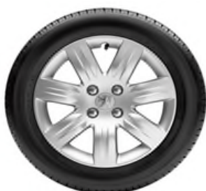
Enjoliveur GRENADE 16"