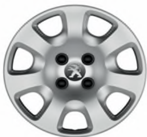
Enjoliveur ATACAMA 15"