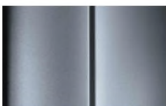
Réf. : COLOR_ZRM0