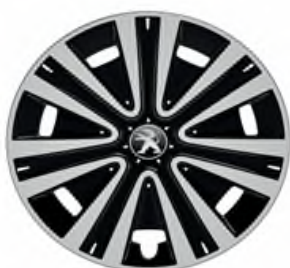
Enjoliveur NATEO 15"