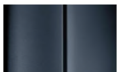
Réf. : COLOR_ZWMO