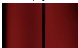
Réf. : COLOR_X9P0