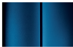
COLOR_WPP0 Image 7 of 7 CLOSE X