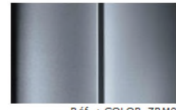
Réf. : COLOR_ZRM0