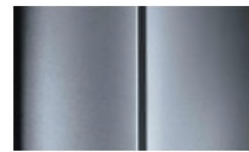
Réf. : COLOR_ZRMO