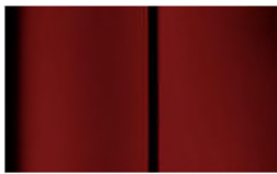
Réf. : COLOR_X9P0