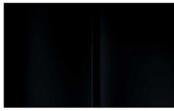
Réf. : COLOR_XYPO