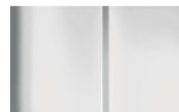
Réf. : COLOR_WPP0