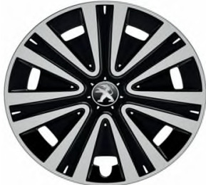
Enjoliveur NATEO 15"