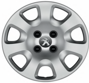
Enjoliveur ATACAMA 15"