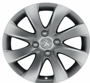
Jante Aluminium MANAGUA 16"