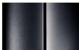
COLOR_XYR0 (Image 13 of 13) CLOSE X