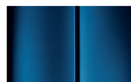
COLOR_XYR0 (Image 14 of 13) CLOSE X