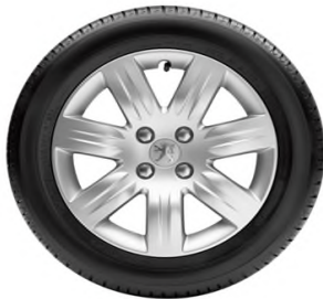
Enjoliveur GRENADE 16"