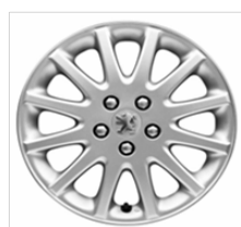
Jantes Alliage Vivace 16"