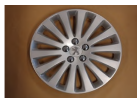
Enjoliveurs Full Cover