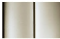
Réf. : COLOR_HBM0