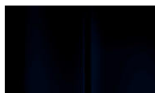
Réf. : COLOR_4PP0